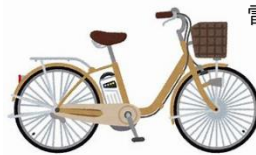
電動アシスト自転車